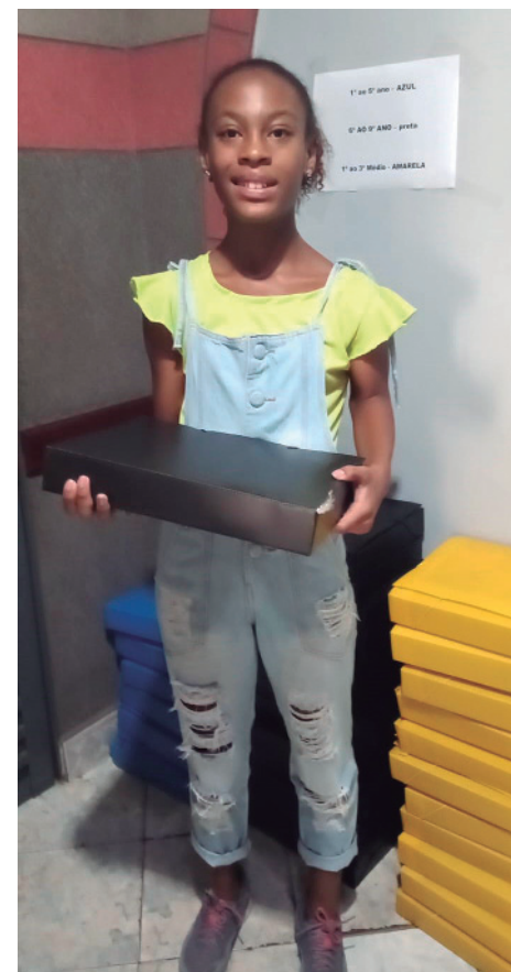
Entrega de materiais escolares no Sindicato.

Há anos o Sindicato dos Municipais oferece kits de material escolar para filhos de associados. As inscrições estão abertas para os matriculados no Ensino Fundamental I, II e Ensino Médio. Esta ação do Sindicato tem como objetivo apoiar os associados no início do ano quando as despesas são elevadas.