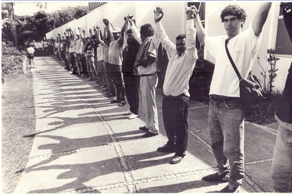
Foto de autoria de José Osmir Bertazzoni em Santa Bárbara, inspiradora da logomarca do Sindicato dos Municipais.

Fundado em 10 de novembro de 1988, o Sindicato dos Trabalhadores Municipais de Piracicaba, São Pedro, Águas de São Pedro, Saltinho e Charqueada possui uma trajetória sólida de atuação em defesa dos direitos dos servidores públicos municipais. Ao longo de sua história, esteve à frente de importantes mobilizações, negociações e conquistas, tornando-se uma das entidades